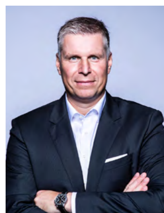
Alexander Schüle division one GmbH