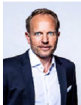
Björn Knothe division one GmbH